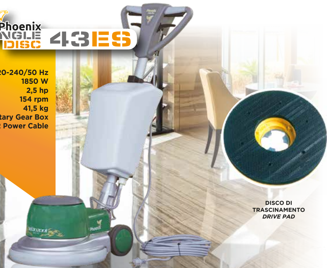
DISCO DI TRASCINAMENTO DRIVE PAD

220-240/50 Hz 1850 W 2,5 hp 154 rpm 41,5 kg Planetary Gear Box 12 Power Cable